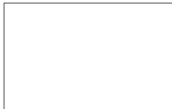
写真 1 写真タイトルの例