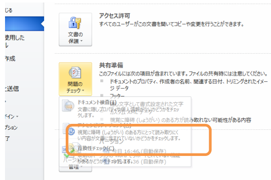
図 2 アクセシビリティチェック画面

Word 文書内から PDF データを作成する際の設定で、「タグ付き PDF でアクセシビリティと折り返しを有効にする」をチェックすることで、文章構造(読み上げ順)や代替テキスト(図や表の内容説明テキスト)の情報を持つ PDF が作成できる。