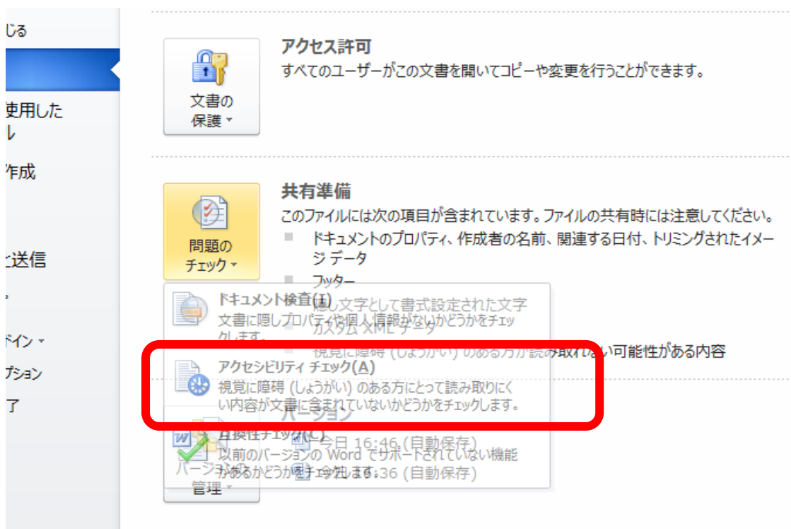
図 1 アクセシビリティチェック画面

Word 文書のバージョンによって操作は多少異なるが、原則として図 2 に示す Word 内の「ファイル」>「情報」>「共有準備」>「アクセシビリティチェック」を実施しエラー等を可能な範囲で修正することで「アクセシビリティチェック済み Word 文書から出力された PDF」（Adobe Reader で表示、印刷、読み上げが可能なもの）の作成が可能となる。