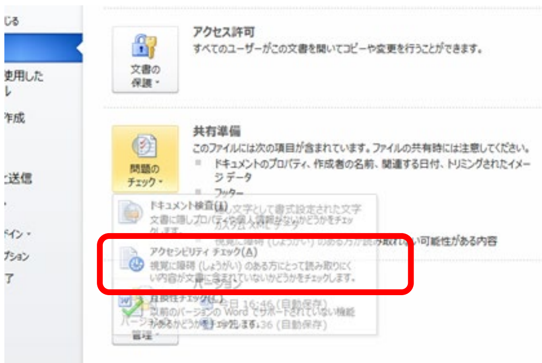
図 1 アクセシビリティチェック画面

Word 文書のバージョンによって操作は多少異なるが、原則として図 2 に示す Word 内の「ファイル」>「情報」>「共有準備」>「アクセシビリティチェック」を実施しエラー等を可能な範囲で修正することで「アクセシビリティチェック済み Word 文書から出力された PDF」(Adobe Reader で表示、印刷、読み上げが可能なもの)の作成が可能となる。